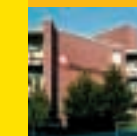
Altenzentrum Haus St. Anna