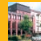
Seniorenzentrum St. Hedwig